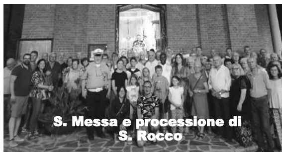
S. Messa e processione di S. Rocco