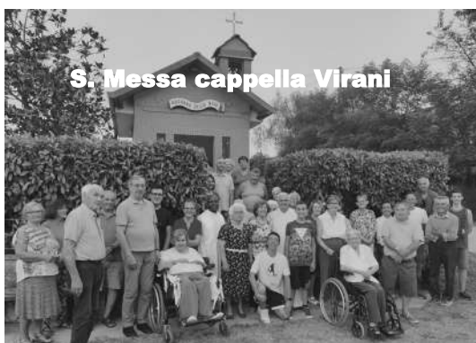
S. Messa cappella Virani