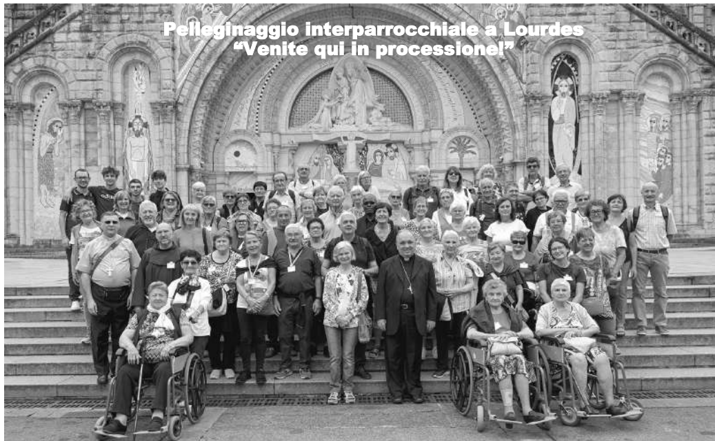
Pelleginaggio interparrocchiale a Lourdes “Venite qui in processione!”