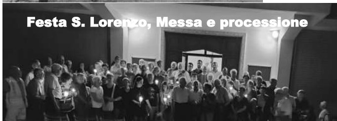
Festa S. Lorenzo, Messa e processione