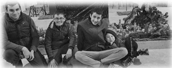
Un bel sorriso dalla chiesa di S. Vito!

Provare per credere... e crederci, se non ci abbiamo ancora provato... provare! In questa settimana intensifichiamo la nostra preghiera partecipando alla novena