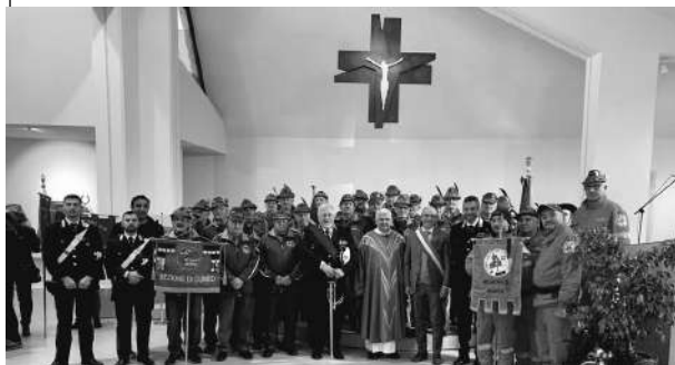
Giornata del 4 novembre a Montà S. Antonio