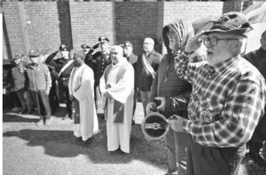
Giornata del 4 novembre a S. Stefano (Nostra Signora delle Grazie)