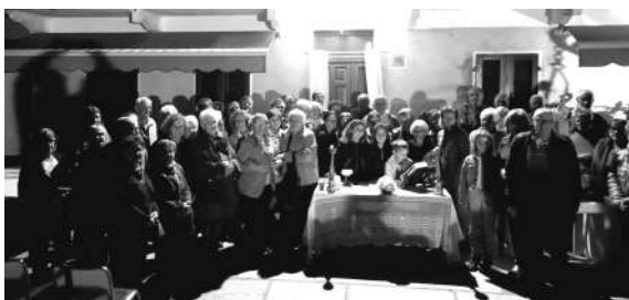
S. Messa ai Boschi di S. Vito 6 ottobre