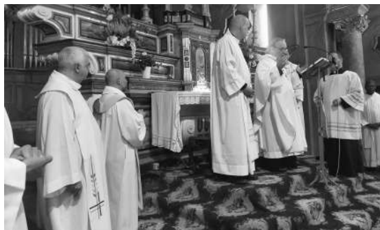
Un momento della Messa presieduta dal vescovo nella chiesa di Canale per la festa di S. Francesco