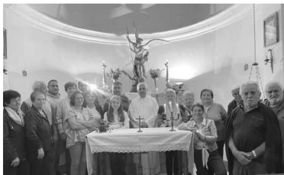
S. Messa nella cappella di S. Michele Bg. Badoni, 3 ottobre