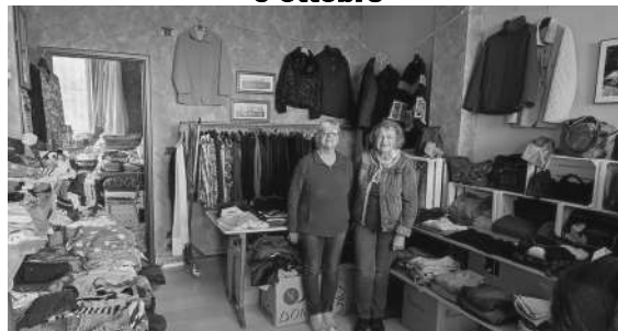
La "Bottega della solidarietà" è aperta il giovedì e il sabato

DIOCESI DI ALBA UNITÀ PASTORALE MONTÀ - SANTO STEFANO ROERO