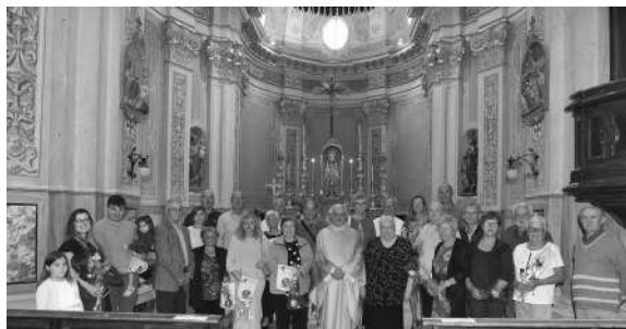
Festa degli anniversari di matrimonio a S. Rocco, domenica 17 settembre