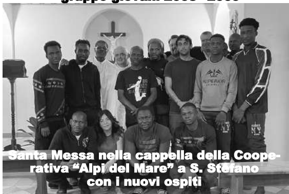
Santa Messa nella cappella della Coe- perativa "Alpi del Mare" a S. Stefano con i nuovi ospiti