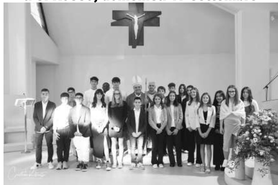
Celebrazione della Cresima a S. Antonio, sabato 23 settembre