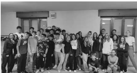
Primo incontro del gruppo giovani 2008 -2009