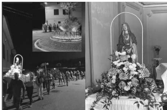
Festa ai Rolandi - 14 settembre