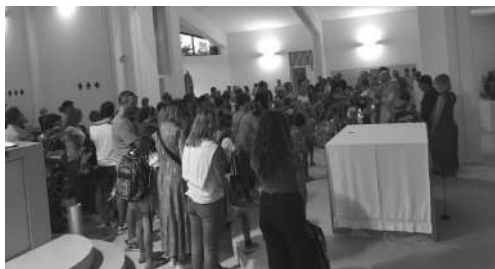
Benedizione degli zainetti a Montà