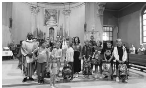
Benedizione degli zainetti a S. Stefano