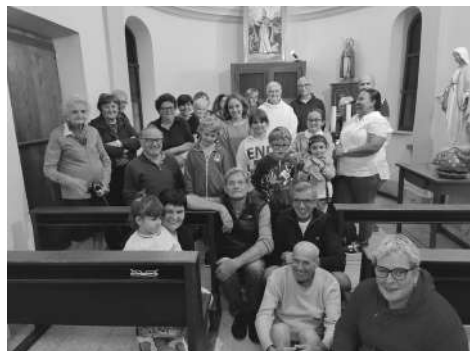
S. Messa a S. Grato di Montà