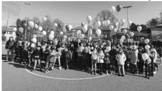
Festa della Pace a Montà