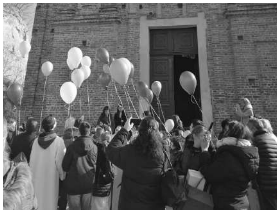
Festa della Pace a S. Stefano