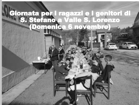
Giornata per i ragazzi e i genitori di S. Stefano a Valle S. Lorenzo (Domenica 6 novembre)