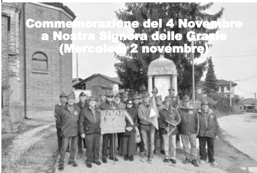
Commemorazione del 4 Novembre a Nostra Signora delle Grazie (Martedì 2 novembre)