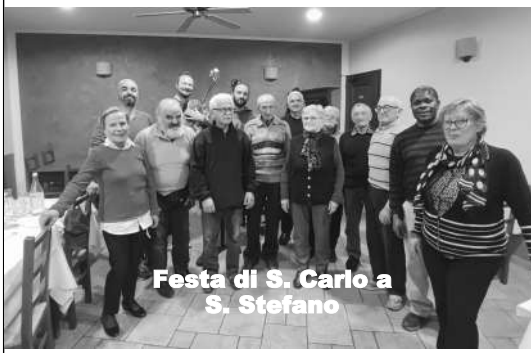
Festa di S. Carlo a S. Stefano