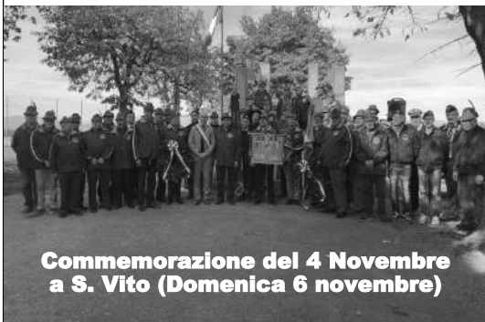
Commemorazione del 4 Novembre a S. Vito (Domenica 6 novembre)