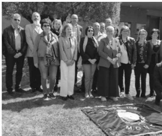
Leva 1967 a Montà